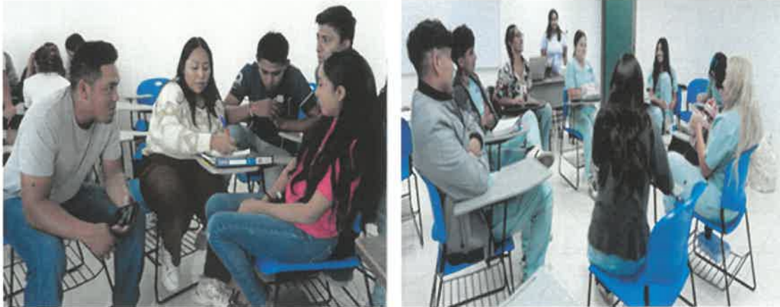
Figura 1. Alumno Monitor durante las sesiones de retroalimentación con sus compañeros.

Los alumnos monitores ayudaron a un total de 68 compañeros que representan un 20.30% con respecto a la matrícula total y que solicitaron apoyo tal como se puede apreciar en la siguiente tabla: