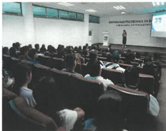
durante las actividades llevadas a cabo en el curso de inducción a los estudiantes de nuevo ingreso al ciclo escolar 2025-2026.