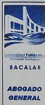
MTRO. ANGEL PALACIOS REGULES ABOGADO GENERAL