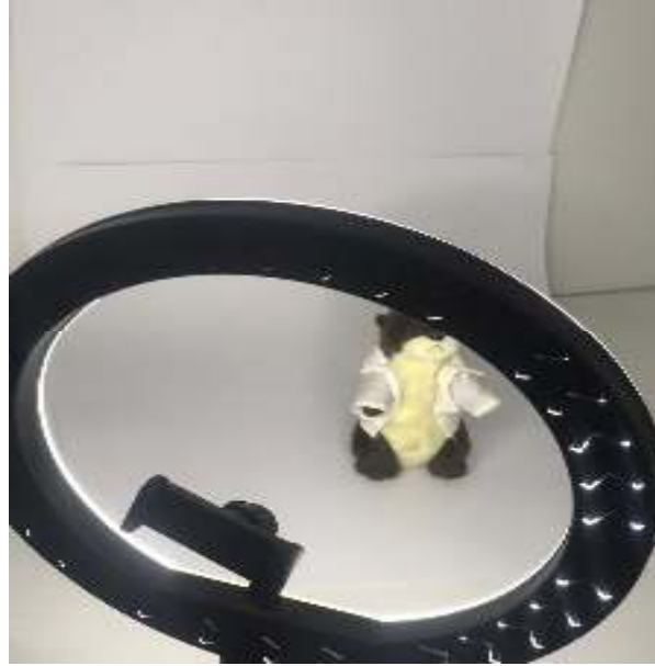
Figura 06.- Pasos para tomar una fotografía.