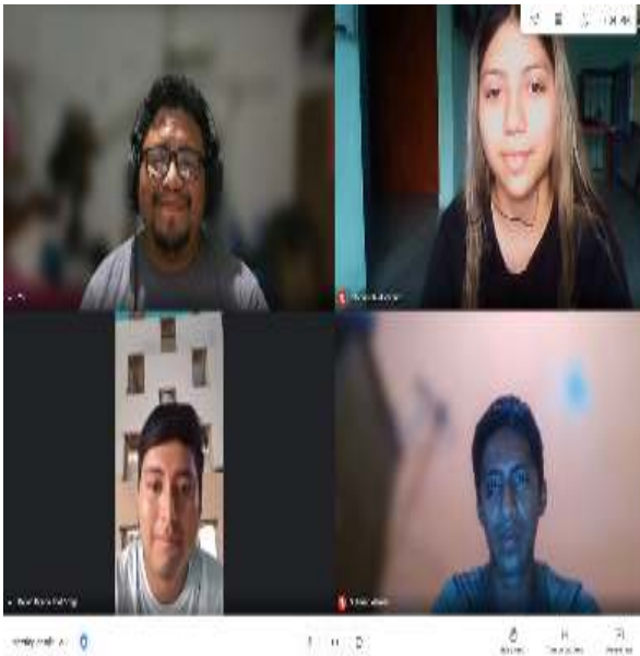
Figura 03.- Clase de presentación de Rondalla.