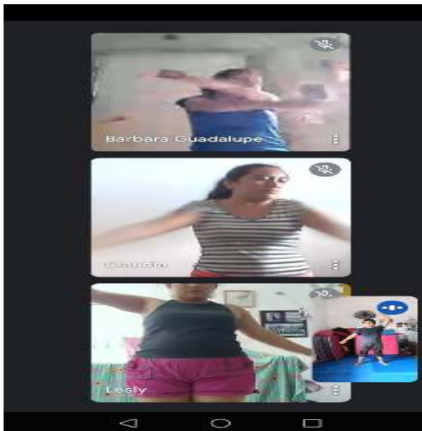
Figura 15.- Alumnas mostrando las posturas iniciales de defensa personal.