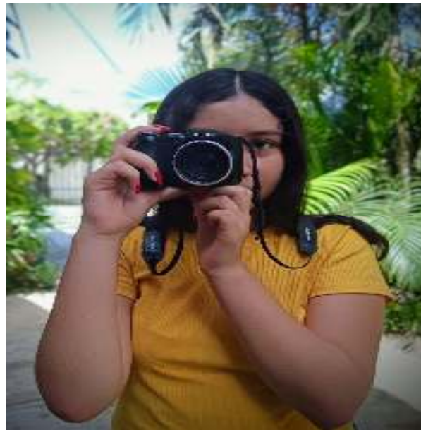
Figura 08.- Presentación de fotografías.