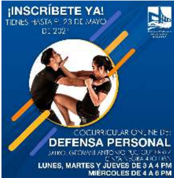
Figura 13.- Cocurricular Defensa Personal.