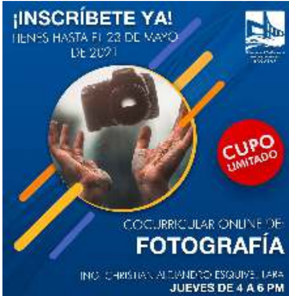
Figura 05.- Cocurricular de fotografía.