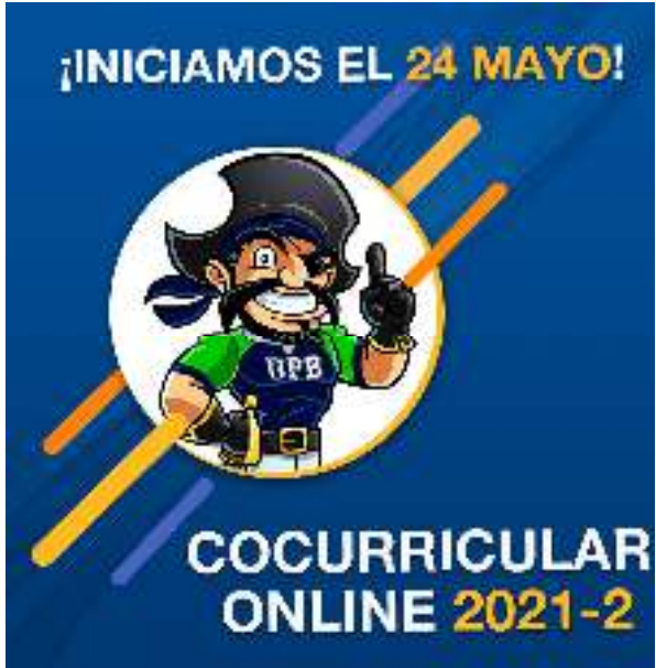
Figura 01.- Invitación a unirse a un cocurricular 2021-2