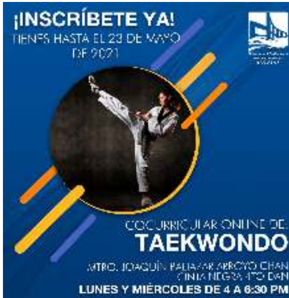
Figura 09.- Cocurricular de Taekwondo.