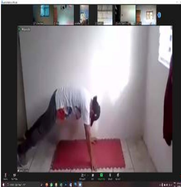
Figura 17.- Inicio de postura para de preparación de ejercicio.