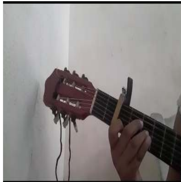
Figura 04.- Indicaciones de como tocar la guitarra.