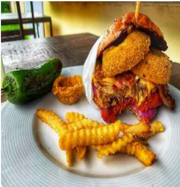
Figura 07.- Presentación de fotografías.