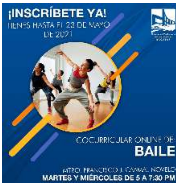
Figura 11.- Cocurricular de Baile.