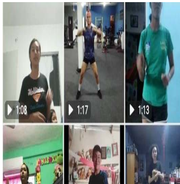
Figura 12.- Alumnos en clase de baile siguiendo a las indicadores del profesor.