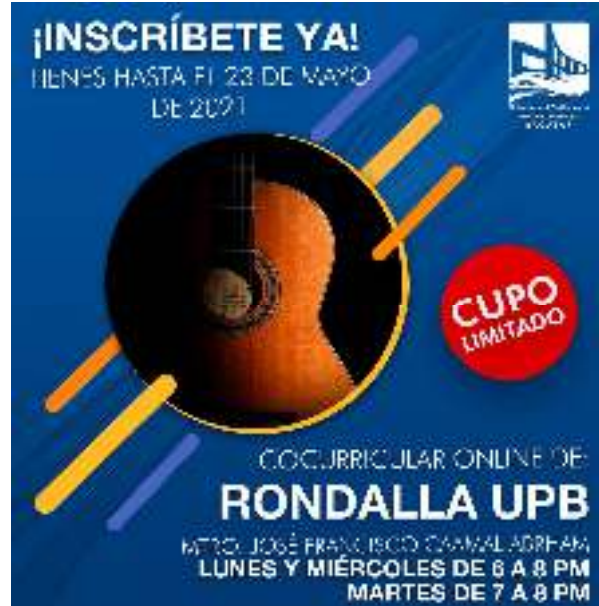
Figura 02.- Cocurricular de Rondalla.