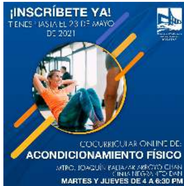
Figura 16.- Cocurricular Acondicionamiento Físico.