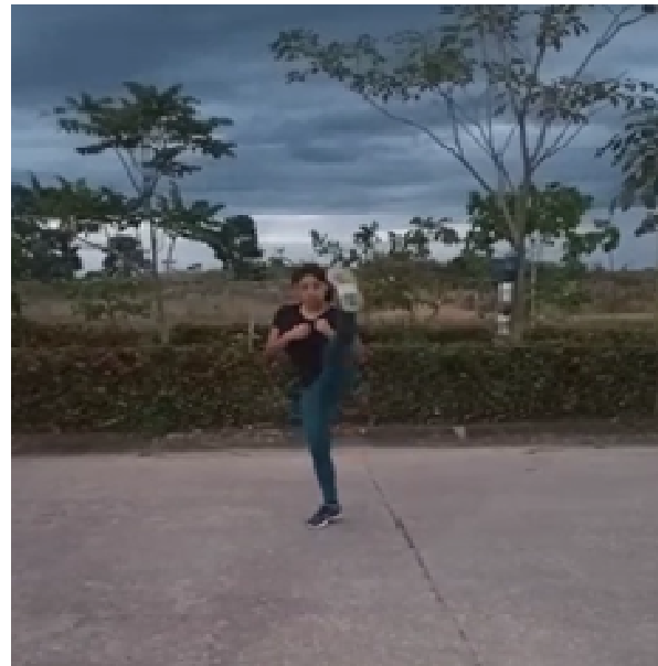
Figura 10.- Presentación de formas.